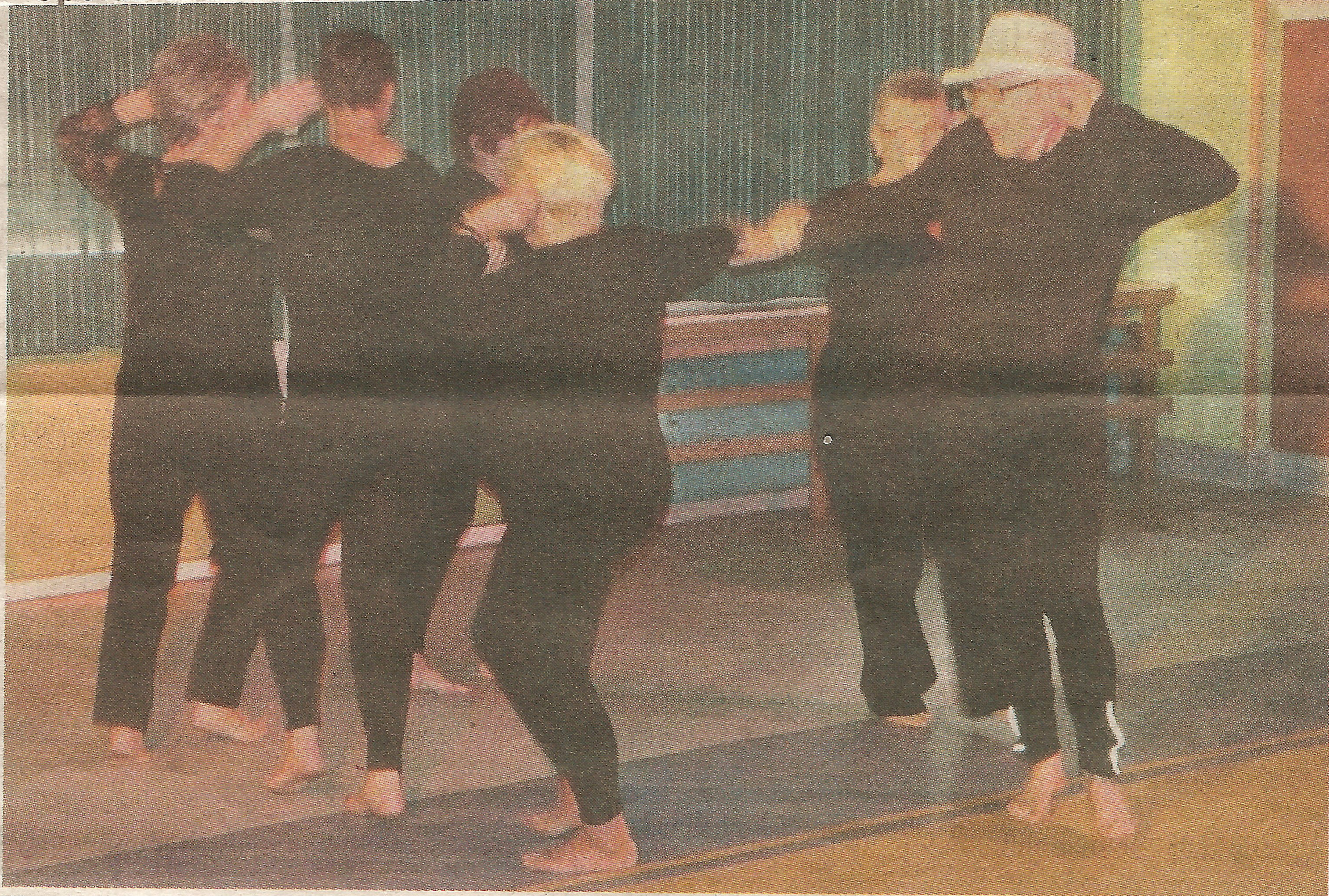
Występ Teatru Tańca „Dawka Energii”.

Jednym z pierwszych punktów programu tegorocznych Dni Podzamcza, był spektakl zaprezentowany w największej sali Ośrodka Społeczno-Kulturalnego Spółdzielni Mieszkaniowej „Podzamcze” przez Stowarzyszenie Radość Życia.